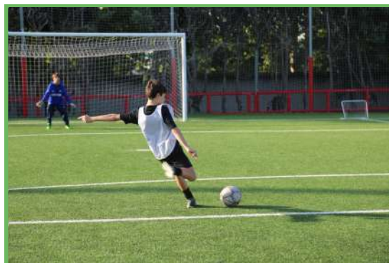
Nuestros jugadores en la tecnificación

Os avanzamos que la primera tecnificación fue un éxito. Un total de 28 futbolistas participasteis porque habéis decidido mejorar. Os esperamos a los demás en las sesiones de este mes de octubre, que anunciaremos también en redes sociales y en la web.