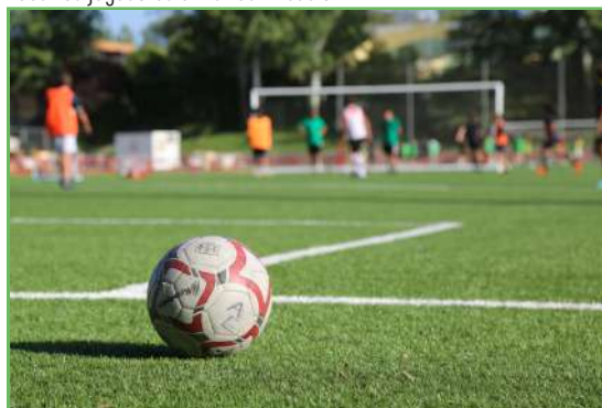
Un momento de la sesión del 24 de septiembre