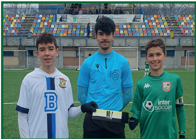
Infantil B - Brains