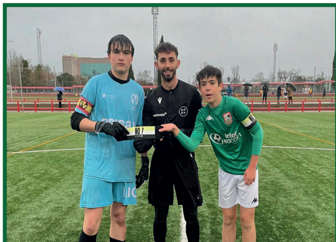
Cadete B - La Moraleja