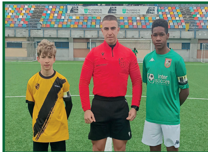
Infantil A - Soto del Real