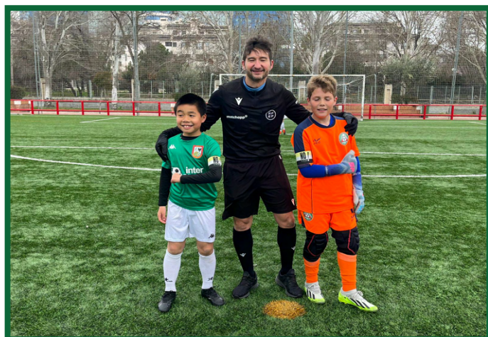
Alevín A F7 - Atlético Alcobendas