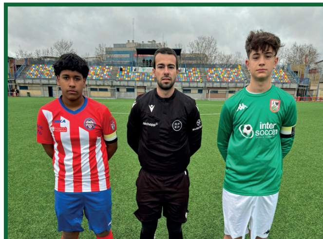
Cadete C - Atlético Concilio