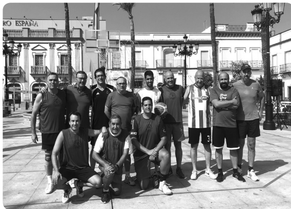
25 horas de baloncesto, ¡una pasada!

• Reuniones de padres/madres (octubre 2019): Cada equipo explicó a los padres y madres los detalles de la campaña y las organizaciones. 67% de asistencia, volvimos a números que nos gustan.