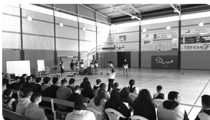
Clínica entrenadores, ¡¡asentándose!!