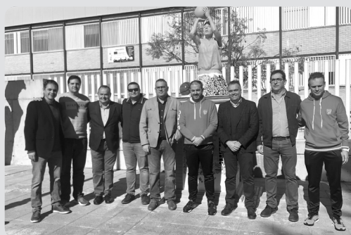
Inauguración monolito 25 años de baloncesto.