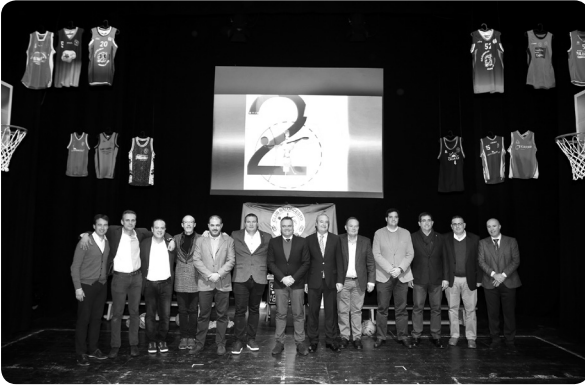
Gala 25 aniversario, ¡HISTÓRICA!

• III Clínic de entrenadores “Ciudad de La Palma” (diciembre 2019): Actividad que logró esta edición 50 entrenadores de asistencia.