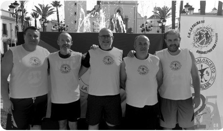
Los 5 socios fundadores del CB95.

H emos trabajado estos 4 años para normalizar y modernizar nuestro Club, adecuando ingresos conforme a gastos y plazos, hemos dotado al club de la mayor inversión en material deportivo de sus 26 años, hemos creado un espacio en la sede cedida por el Ayto. 100% funcional para todo el club, hemos implantado un plan de calidad para nuestros entrenadores que ha ayudado a dar un paso más a nuestro proyecto deportivo, y hemos mejorado la imagen de la entidad modernizándola a través de la ropa, por lo que me siento muy satisfecho por el trabajo realizado en este ciclo directivo.