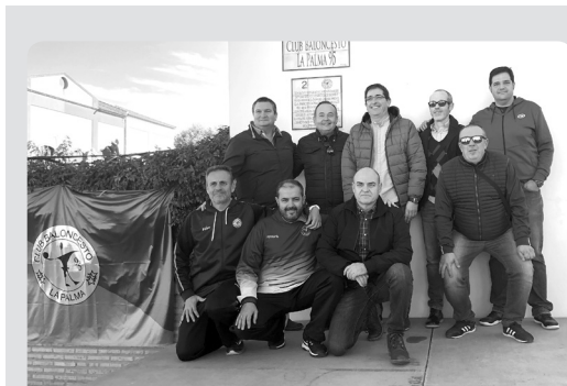
Inauguración plaza CB La Palma 95.

En lo deportivo, unos comienzos con tan solo dos equipos y que con el paso de los años se ha llegado a lo que hoy es el Club, equipos en todas las categorías tanto masculino como femenino, y todas las edades desde los más pequeños hasta los más grandes desde luego, un gran logro. En cuanto a trabajo realizado en el tema deportivo hay que agradecer esa labor de los entrenadores, pero sobre todo a la labor de una persona muy fundamental en este