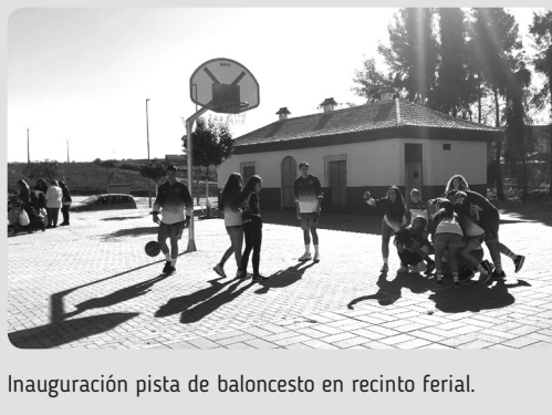
Inauguración pista de baloncesto en recinto ferial.

Club, el Director Deportivo, que gracias a él y a su labor en estos 25 años ininterrumpidos se han conseguido todos los logros, no solo en lo deportivo sino en valores, amistad, compañerismo y sobre todo equipo. Logros deportivos como el primer ascenso a primera andaluza sénior, como esa primera vez que se logró participar en el Campeonato de Andalucía en mini masculino y de ahí a nuestros días, más ascensos a categoría nacional, muchas participaciones en campeonatos de Andalucía, muchos campeonatos y subcampeonatos en la liga federada de Huelva tanto en masculino como en femenino, muchos logros que sin el trabajo de muchas personas no se hubieran conseguido.