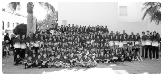
CB95, ¡¡26 años ilusionando!!

En la categoría cadete nos ha costado encontrar el nivel de