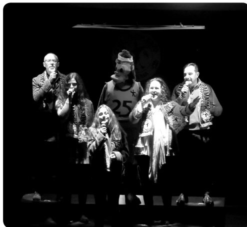
Himno del club.

...Esta temporada se ha creado una ESCUELA DE MADRES que se han organizado los jueves a las 20:30h para entrenar con casi 30 participantes denominándose “LAS PILAS” por ser