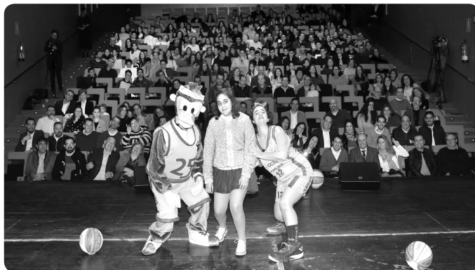
Mascota del club.