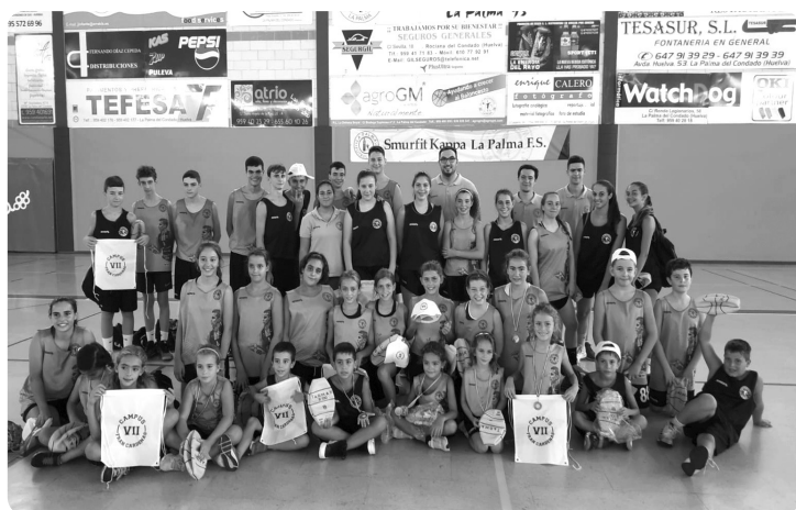
VII Campus Fran Cárdenas.