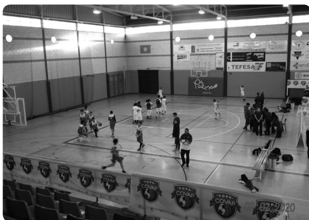
Copa Covap, 2 finales jugadas.