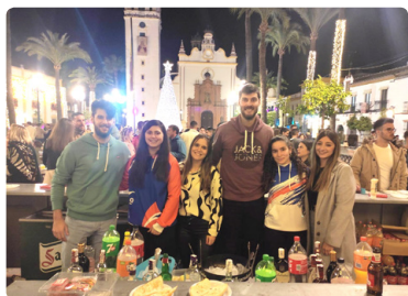
Barra en inicio de Navidad, gran trabajo.

¡Gracias a todos por ser parte de esta gran familia! ¡Hasta la próxima temporada!