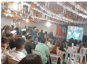
Caseta de feria, nueva gestion.