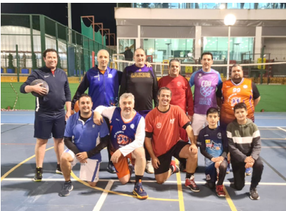
Jueves de pachanga, creciendo.