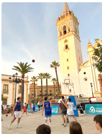
3x3 de verano.

También quiero extender mi agradecimiento a nuestros colaboradores y patrocinadores, cuyo apoyo incondicional ha sido vital para el funcionamiento y el éxito de nuestro club. Su generosidad nos ha permitido contar con los recursos necesarios para mejorar la imagen de los componentes de nuestro club, adquirir