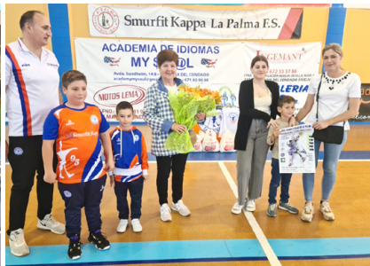
XXIII Torneo Toni.

...Este año por problemas de fechas no hemos celebrado el Torneo de Primavera.