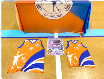
Volvió Día de la Amistad.

Sanlúcar, minis y La Palma ya no volverán a unirse más, pero se llevan en el corazón para toda la vida, ¡gloria bendita!