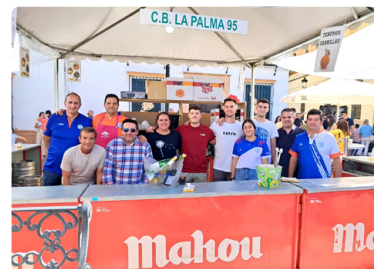
Habas con poleo, ambientazo.