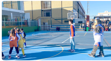
Concentraciones peques, siempre en La Palma.

En la coordinación masculina estamos "en un valle" donde lo más destacable está siendo el número de jugadores que estamos consiguiendo que hará ya para la próxima temporada equipos muy estables. Nos falta subir más la exigencia y la competitividad de los jugadores, para ello debemos apostar más por los retos del día a día. Nuestros juniors rozaron el Campeonato de Andalucía después de realizar una temporada de menos a más, en cadetes hemos progresado y sentado las bases para el año que viene poder tocar más los puestos de calidad, en infantil somos competitivos, pero nos faltan detalles finales para ser 1º ó 2º y en minis este año no podemos evaluar la competición