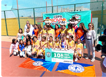
Mini femenino, Campeonas X Copa Covap.

La categoría mini, esa a la que cualquier entrenador/a, jugador/a, padre/madre, aficionado/a siempre la recuerda como la mejor de sus años en el baloncesto. Todo empieza